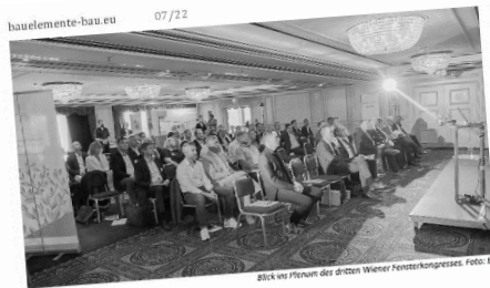
bb-Nachlese: Dritter Wiener Fensterkongress (23. und 24. Juni 2022)